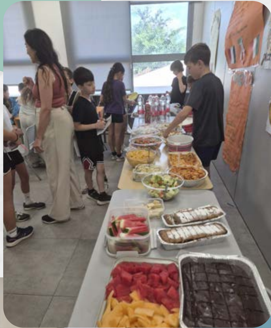
פרוייקט המסעדה בשיעור אנגלית