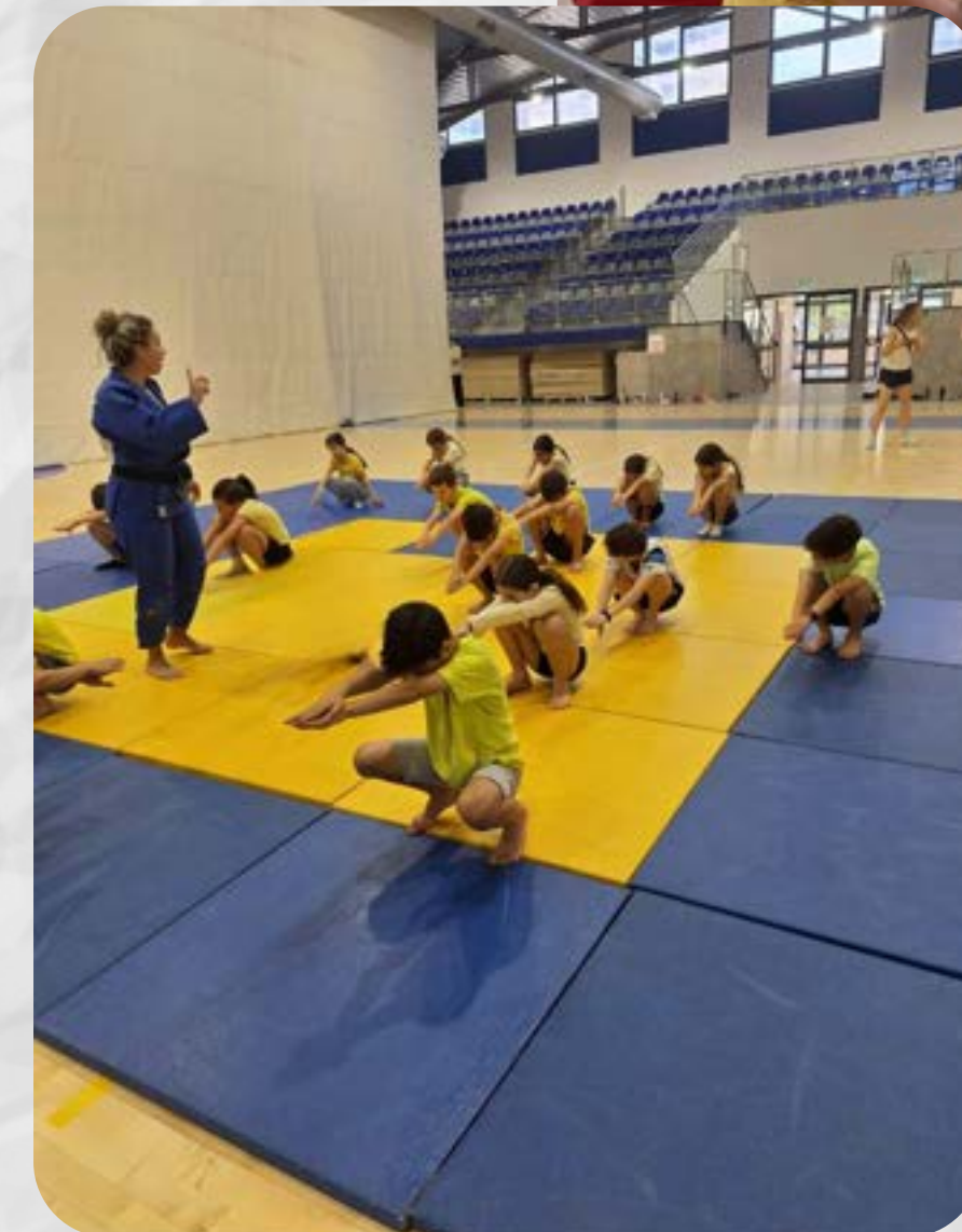
נהנים ביום ספורט קהילתי