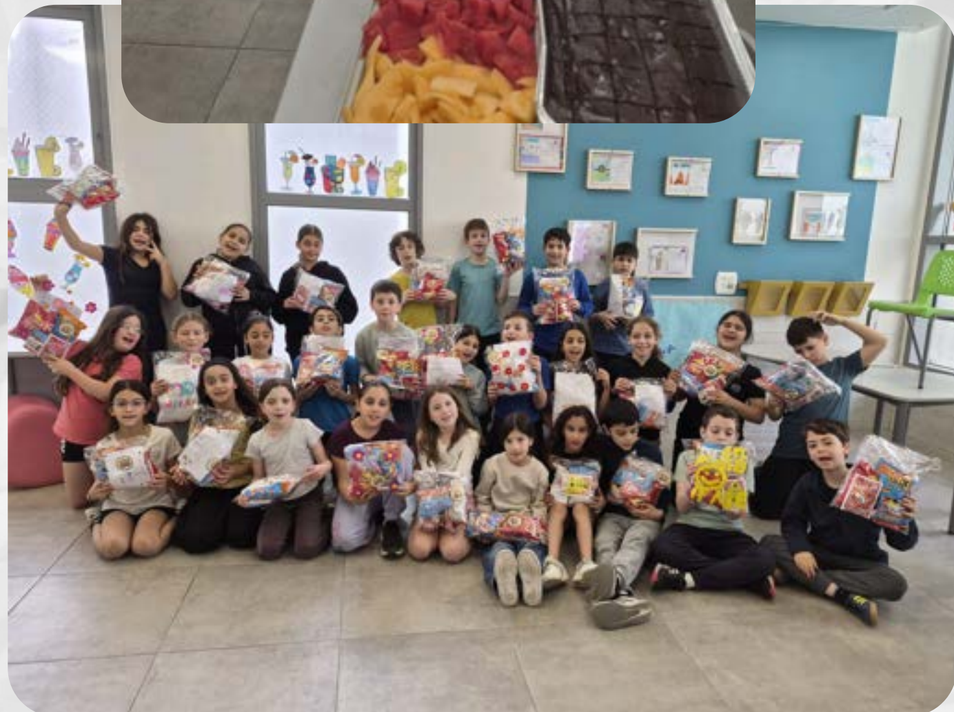
לכבוד פורים מכינים משלוחי מנות לחיילים וכותבים ברכה אישית