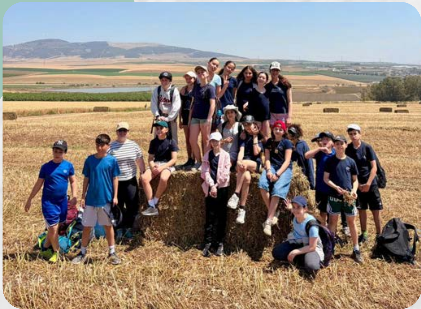
טיול שנתי בעמק יזרעאל