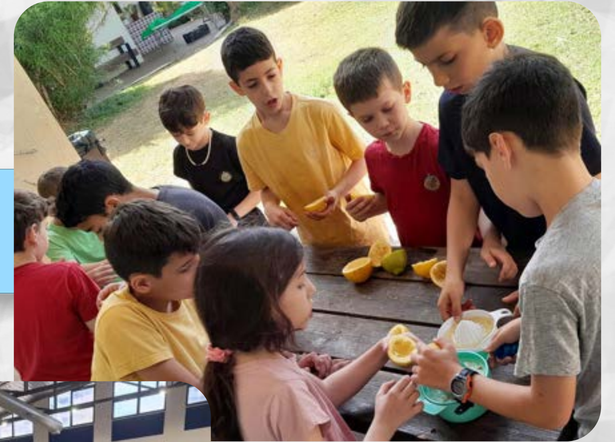
מכינים לימונדה בחווה החקלאית