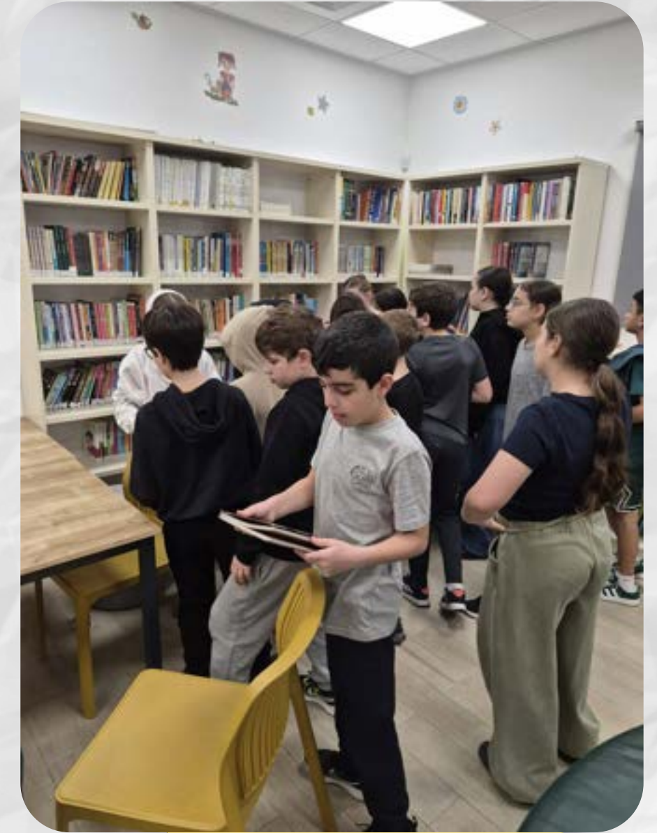
קוראים ומחליפים ספרים בספרייה באופן קבוע