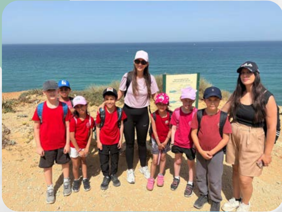
טיול שנתי לשמורת חוף השרון

האוצר האבוד - שכבה ב' הובילו את הפרויקט מול כל בית הספר, איסוף מטבעות אבודים של 10 אגורות. עודדנו, אספנו וספרנו. הכסף יתרם לאחת העמותות לפי בחירת השכבה