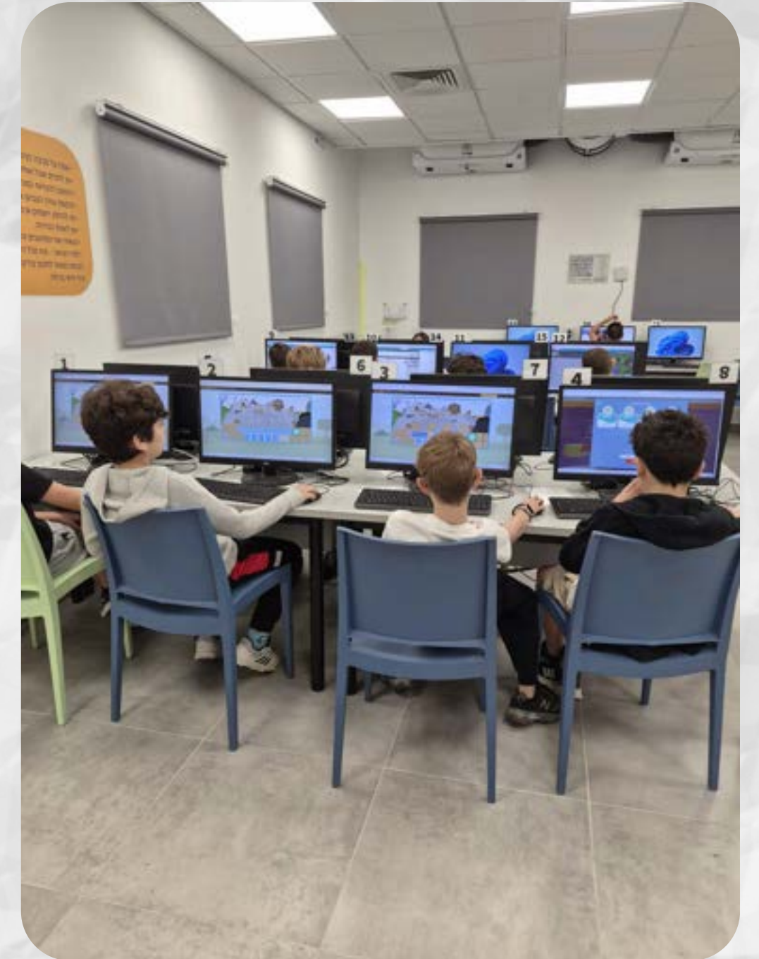
שבוע שעת הקוד