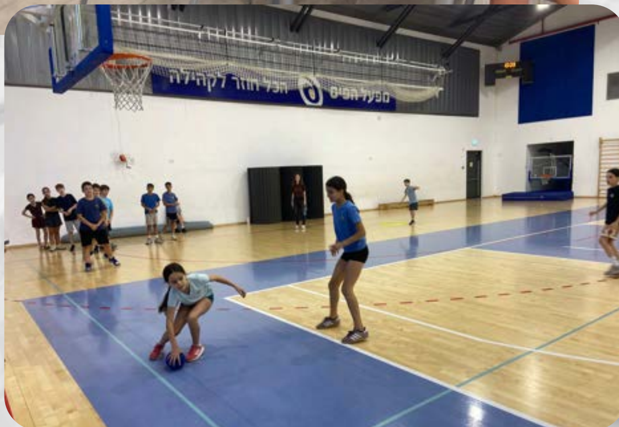
יום ספורט קהילתי