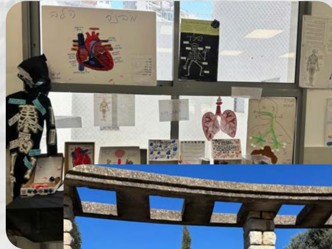
פרוייקט סיכום שנה במדעים, מערכות גוף האדם