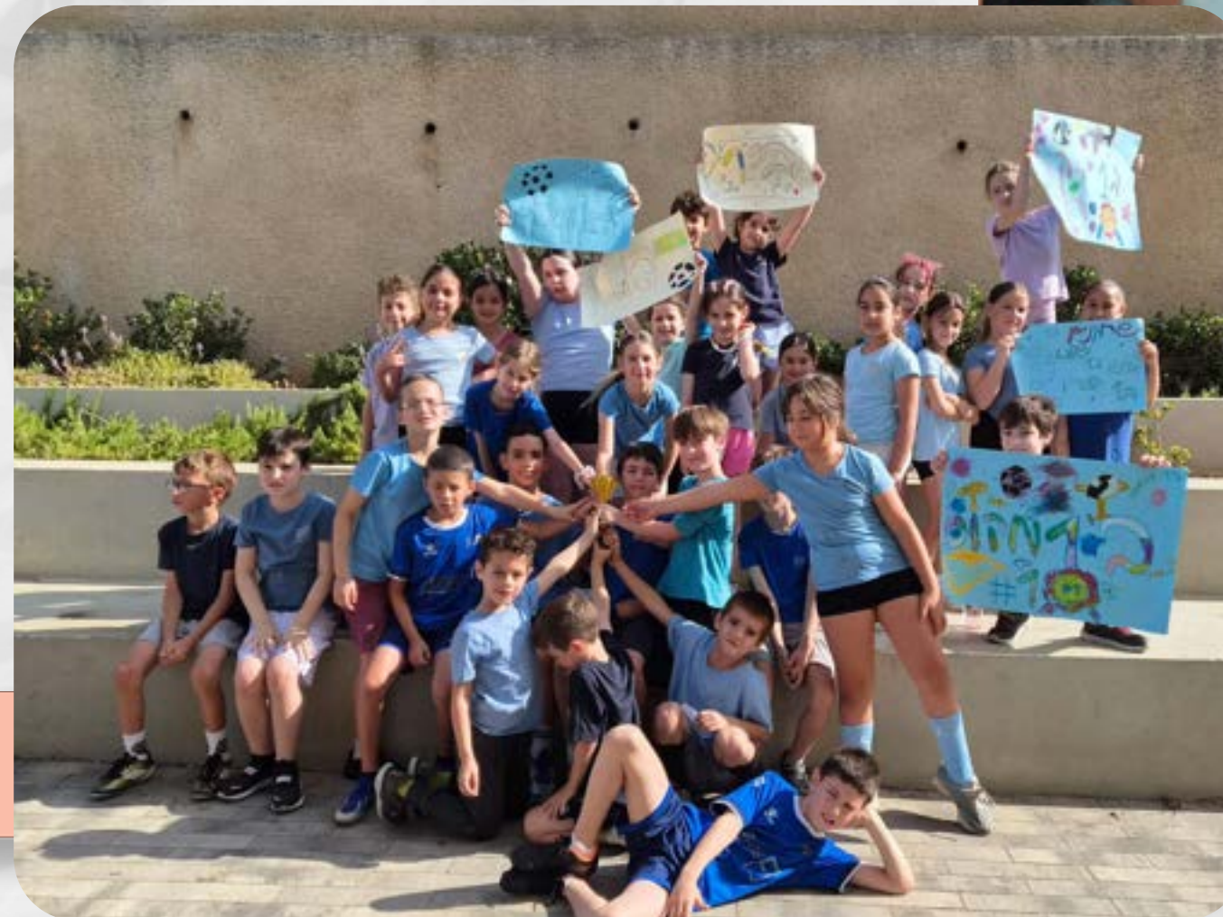
טורניר כדורגל שכבתי