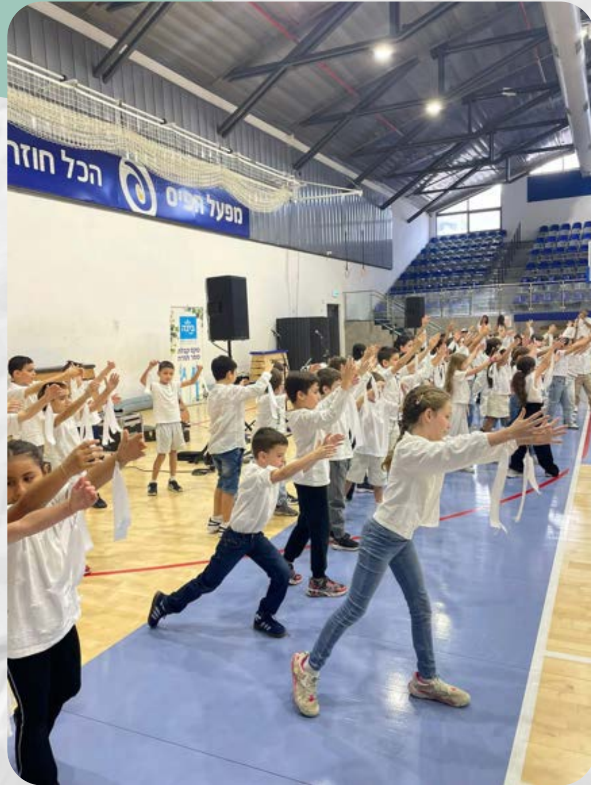
שכבה ב' - טקס קבלת ספר תורה