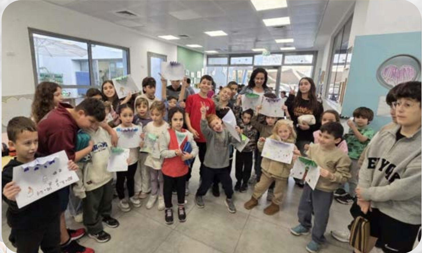
שכבה ו' חונכת את שכבה א' פעילות חורף - יצירת מטריה למילים