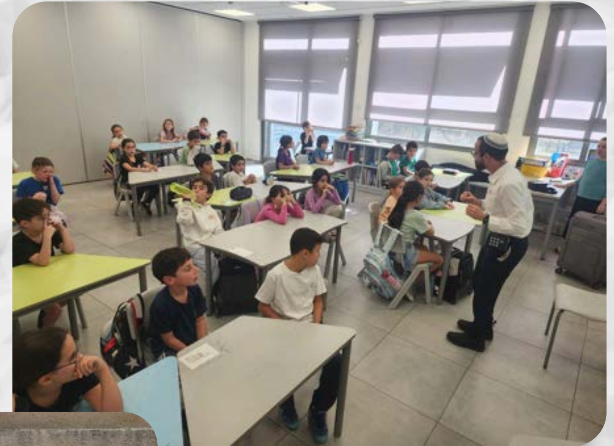
פעילות סופר סת"ם לשכבה ב'