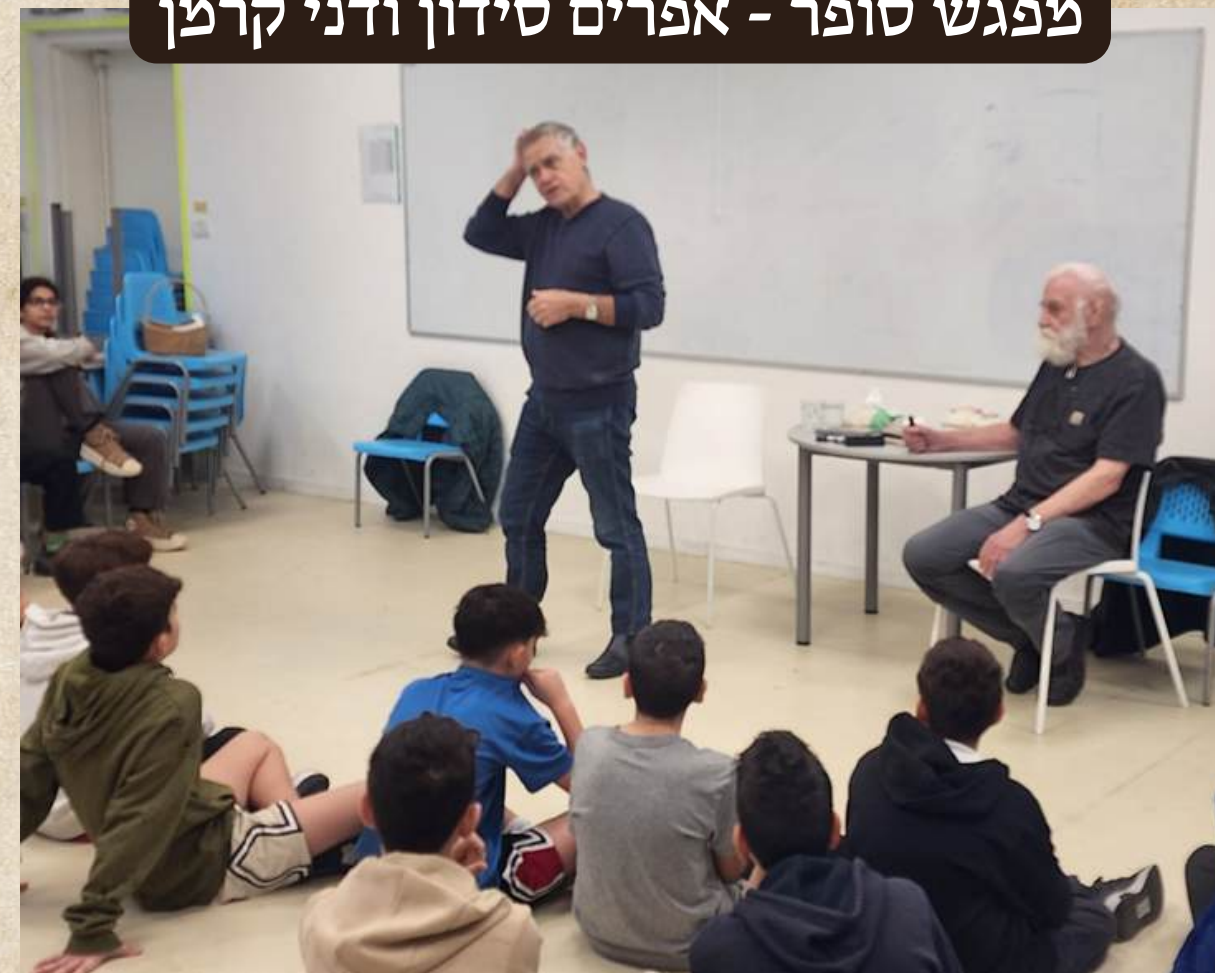
מפגש סופר - אפרים סידון ודני קרמן