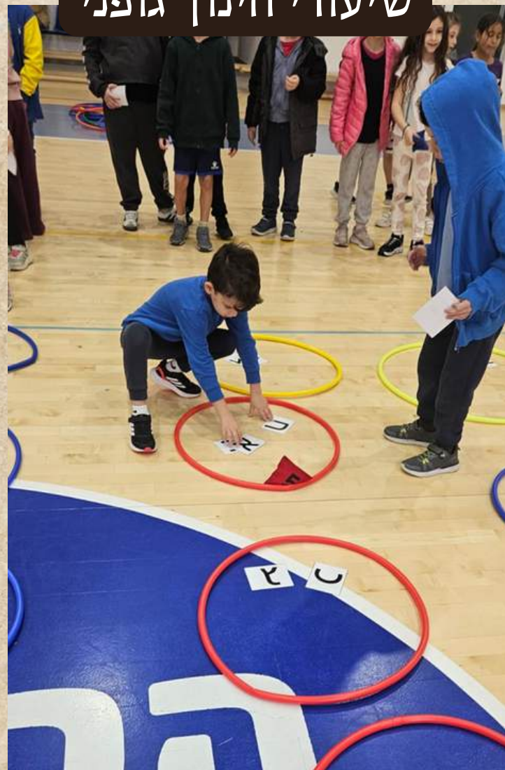
שיעורי חינוך גופני